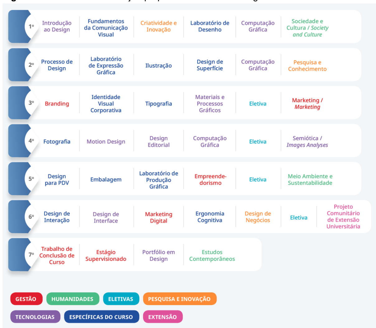
Figura 1: Movimento da formação proposta no Curso de Design Gráfico.