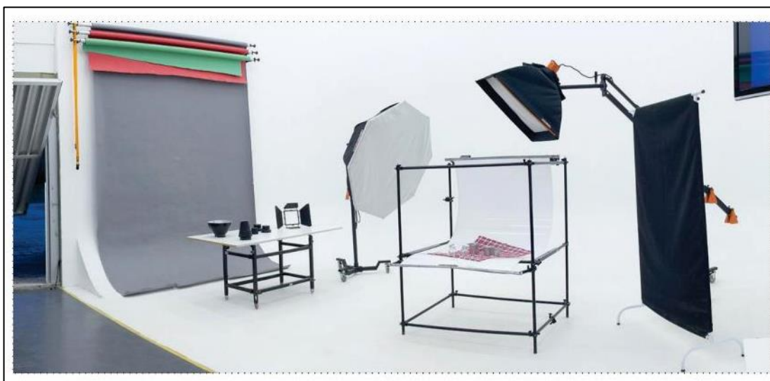
Figura 2: Laboratório de fotografia

Além de outros pequenos itens como adaptadores, cabos, presilhas, anéis de junção e maletas de transporte. Permitindo assim que todos os equipamentos possam ser usados nas mais diversas técnicas e necessidades. No estúdio fotográfico há um fundo infinito que também dispõe de cantos infinitos e altura compatível ao pé direito do ambiente. Para produtos e pequenos objetos há uma mesa de still grande com diversas regulagens e possibilidades de uso. Há também na estrutura do estúdio, 2 tapadeiras de luz que podem ser adaptadas a diversos usos. As portas do estúdio são bem grandes e podem ser abertas a área externa permitindo que consigamos trazer objetos de diversos tamanhos para o espaço interno, como móveis, motos, cenários e muito mais.